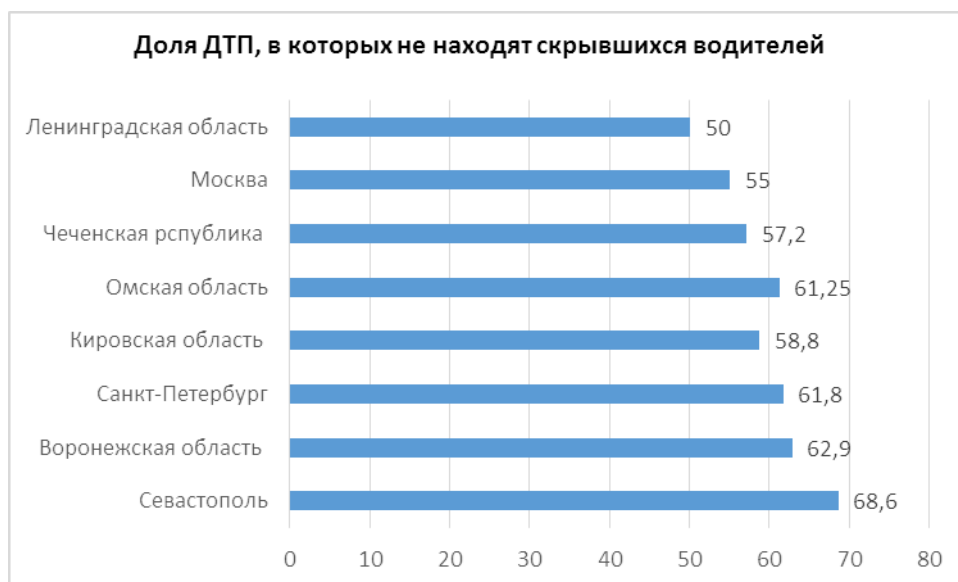
Рис. 1. Доля ДТП, в которых не находят скрывшихся с места происшествия водителей, % [3]

Ужесточение закона по рассматриваемым преступлениям постепенно дает результаты. Так, в 2019 году число смертей в ДТП медленно, но снижается.