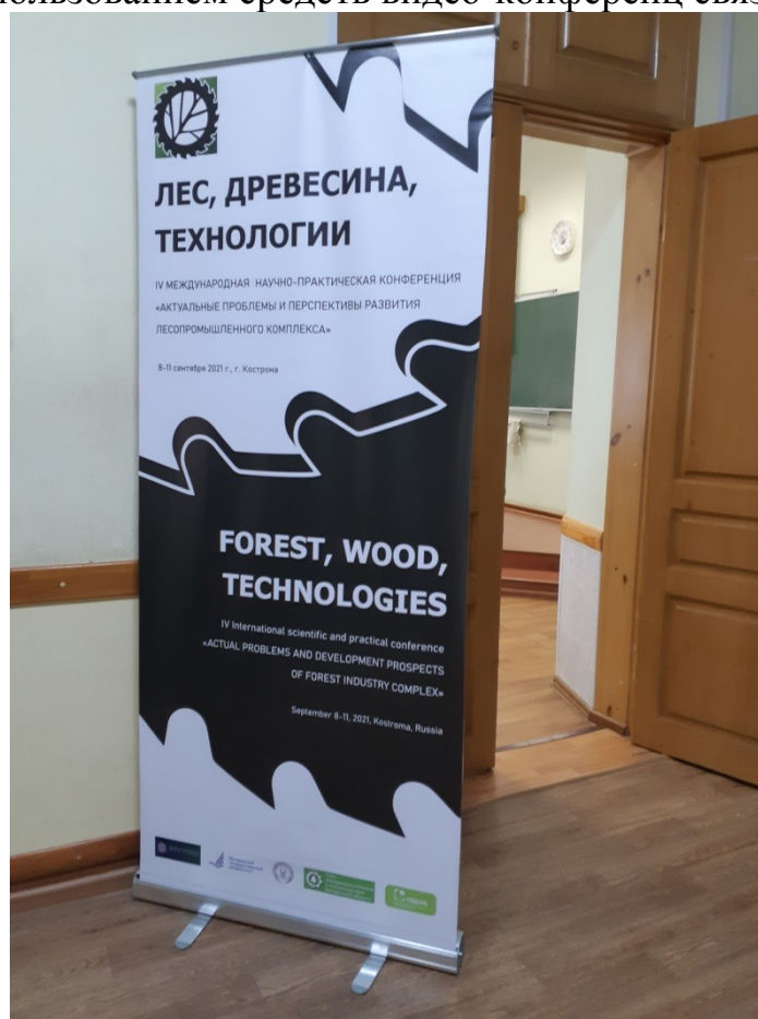
К началу работы IV научно-практической конференции нашими коллегами с кафедр ДТМ и ЭПТ был разработан логотип

С 8-го по 11-е сентября 2021 г. в Костромском государственном университете состоялась IV Международная научно-практическая конференция «АКТУАЛЬНЫЕ ПРОБЛЕМЫ И ПЕРСПЕКТИВЫ РАЗВИТИЯ ЛЕСОПРОМЫШЛЕННОГО КОМПЛЕКСА». Учредители конференции: Костромской государственной университет, Мытищинский филиал Московского государственного технического университета имени Н. Э. Баумана. В связи введенными ограничениями по предотвращению распространения новой коронавирусной инфекции Covid-19 конференция проводилась с использованием средств видео-конференц связи.