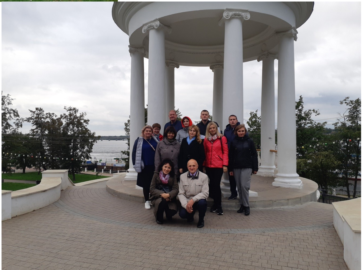
Во второй день было организовано выездное заседание в Костромской государственной историко-архитектурной и художественной музей-