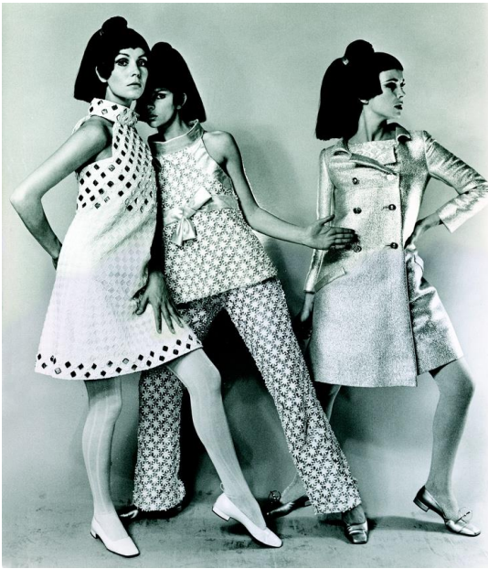
Андре Курреж (дизайнер). 1960-е гг.