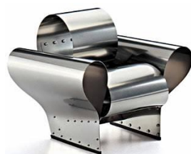
Рон Арад. Стальное кресло «Well-Tempered Chair», «Хорошо закаленный стул». Англия. 1986 г.