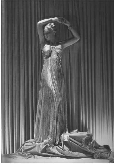
Мадлен Вионне (дизайнер). Платье в античном стиле с горловиной-петлей каплей Вионне. 1937 г.