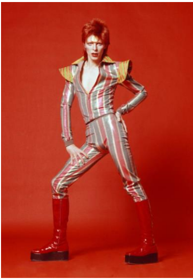
Дэвид Боуи (поп-певец, модель на фото) в Кансай Ямамото (дизайнер). 1970-е гг.