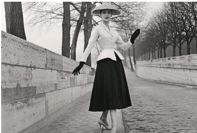
Илл. №1. Кристиан Диор. Ансамбль «Бар».

Вопрос 1. Дайте краткую характеристику эпохи или временного периода в истории дизайна, к которому принадлежит представленный объект (илл. №1). Укажите, какие стилистические черты позволяют отнести его к данному историческому периоду.