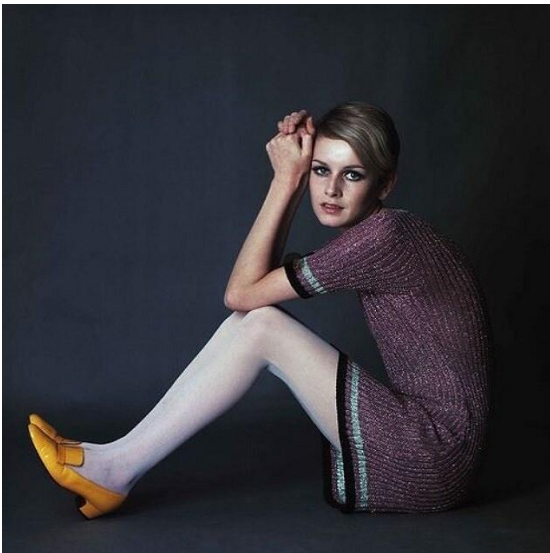
Твигги («икона» стиля и модель на фото). 1960-е гг.