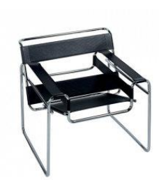
Марсель Брейер. Кресло «Василий». Германия. 1925 г.