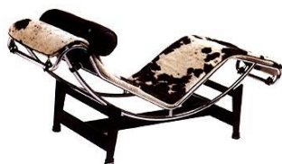
Ле Корбюзье. Шезлонг с регулировкой наклона. Франция. 1928 г.