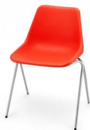
Робин Дей. «Полипроп-стул». Великобритания. 1963 г.