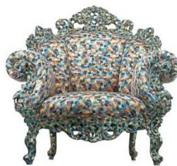
Алессандро Мендини. Кресло «Пруст». Италия. 1978 г.