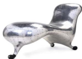
Марк Ньюсон. Кресло «Lockheed Lounge», Локхид лаунж. Австралия. 1985 г.