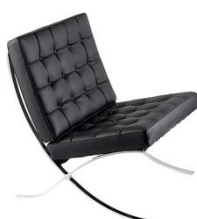
Людвиг Мис ван дер Роë. Кресло «Барселона». Германия. 1929 г.