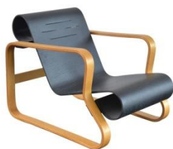
Альвар Аалто. Кресло «Паймио» из гнутой фанеры. Финляндия. 1930-1933 гг.