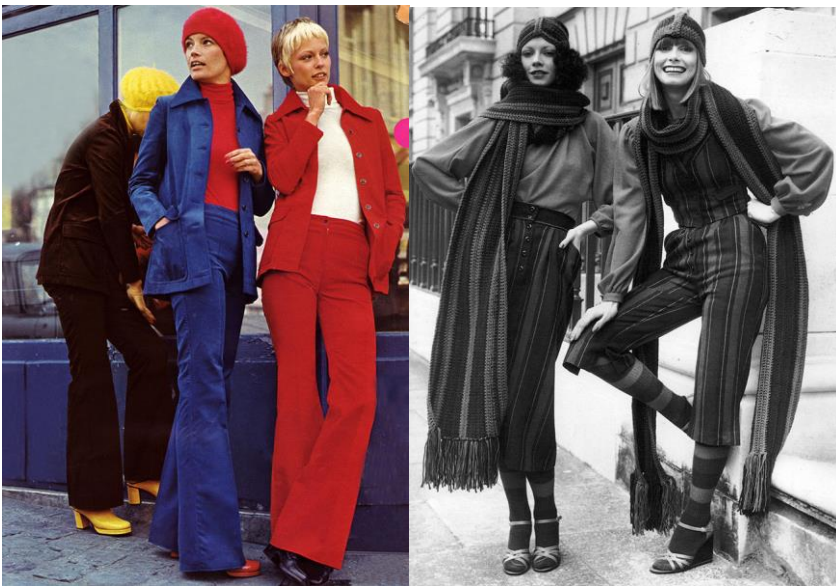
Фото из журналов мод 1970-х гг.