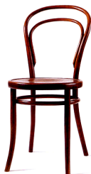
Михаэль Тонет. «Потребительский стул № 14». Австрия. 1859 г.