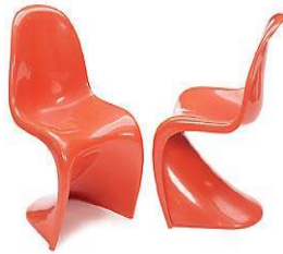
Вернер Пантон. S-образный стул «Пантон». Дания. 1967 г.