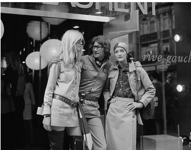
Ив Сен-Лоран (дизайнер) с моделями в платьях в стиле «сафари». 1968 г.