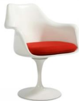
Эро Сааринен. Стул «Тюльпан». США. 1956 г.