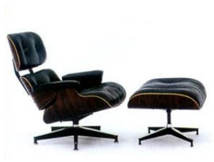
Чарльз Имз и Рэй Имз. Кресло-шезлонг с оттоманкой. США. 1951 г.