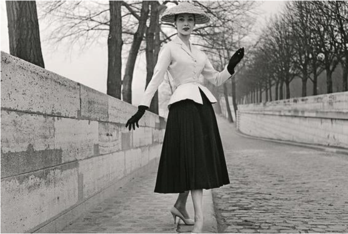
Кристиан Диор. Жакет «Бар». Ансамбль в стиле «New Look». 1947 г.