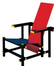
Геррит Ритфельд. Красно-синее кресло. Германия. 1918 г.