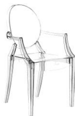
Филипп Старк. Стул «Призрак Людовика» (Louis Ghost). Франция. 1982 г.