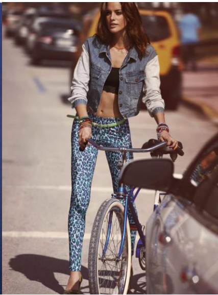
Фото из журналов мод 1980-х гг.