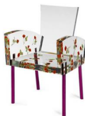
Широ Курамата. Стул «Miss Blanche» из термопласта. Япония. 1988 г.