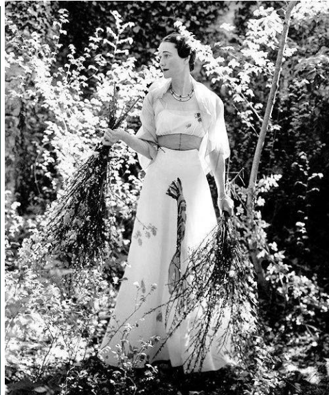
Платье с омаром и петрушкой. Эльза Скиапарелли (дизайнер). Герцогиня Виндзорская (модель на фото). 1936 г.