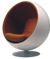
Еэро Арнио. Кресло Ball (Globe). Финляндия. 1966 г.