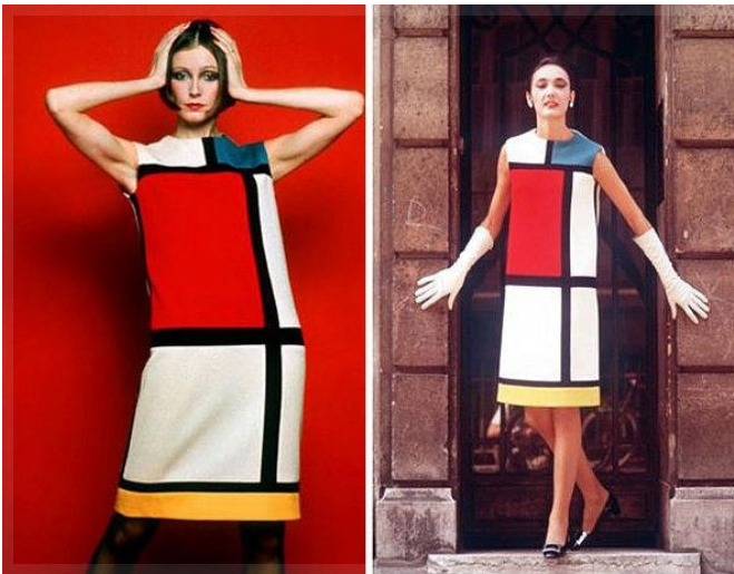
Ив Сен-Лоран (дизайнер). Платье «Мондриан». 1965–1966 гг.