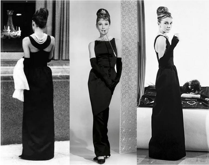
Юбер Живанши (дизайнер). Черное платье для Одри Хепберн (актриса, модель на фото) кинофильма «Завтрак у Тиффани». 1961 г.