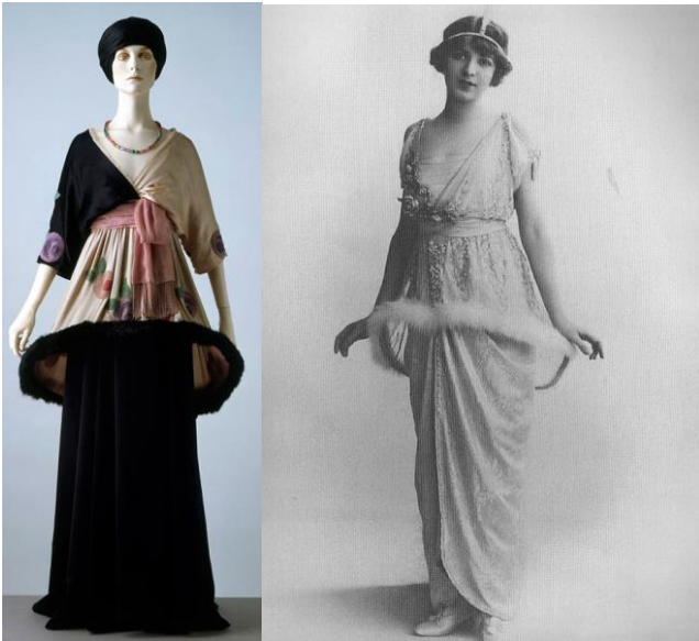
Поль Пуаре. Туника-«абажур». 1910-е гг.