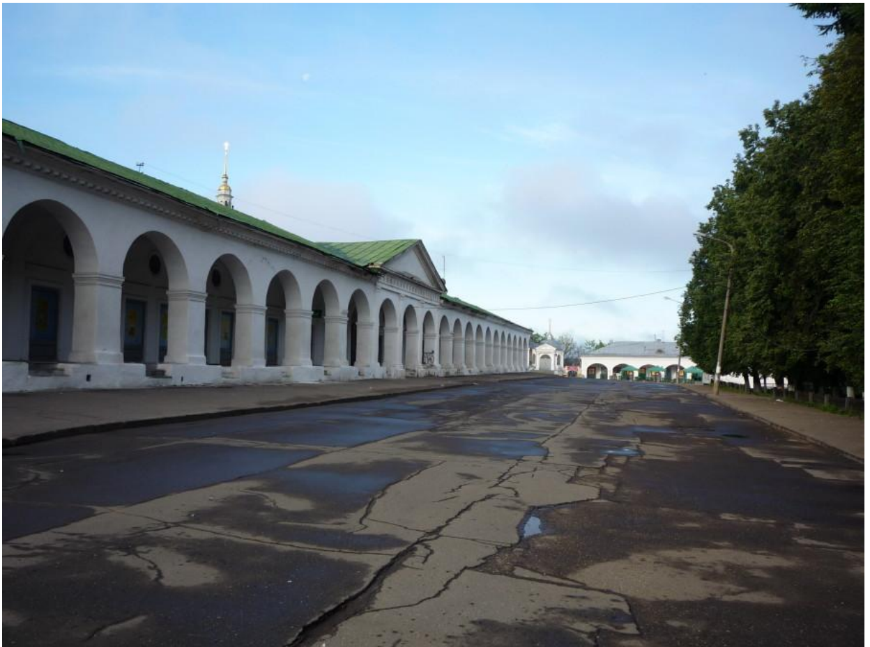
Красные ряды (конец XVIII—начало XIX веков)

К середине XVII века Кострома по своему экономическому развитию становится третьим после Москвы и Ярославля городом Московской Руси. Костромские купцы торговали с Востоком и Западом. Тогда же в Костроме возникает большой торговый центр — мясные, мучные, соляные, калашные, шубные торговые ряды.