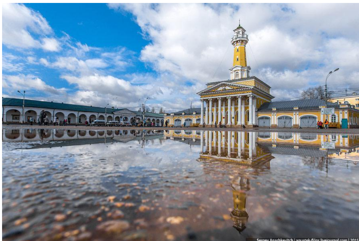
Пожарная каланча - один из главных символов Костромы

Кострома – древний город в Центральной России (340 км от Москвы), входящий в маршрут Золотого кольца. Это крупный речной порт на Волге. Численность населения на 1 января 2016 года – 276691 человек. Туристов готовы принять 20 музеев, 3 театра, 5 концертных залов. Здесь много вариантов видов отдыха: активного, познавательного, оздоровительного. Многих Кострома привлекает тем, что здесь сохранился архитектурный ансамбль XIX века с неповторимой веерной застройкой исторической части города. В настоящее время ведутся работы по восстановлению памятников историко-культурного наследия, а значит, варианты маршрутов по древнему городу будут только увеличиваться. Для Костромы много значит её история и традиции, поэтому, возможно, и туристам стоит узнать больше о прошлом города.