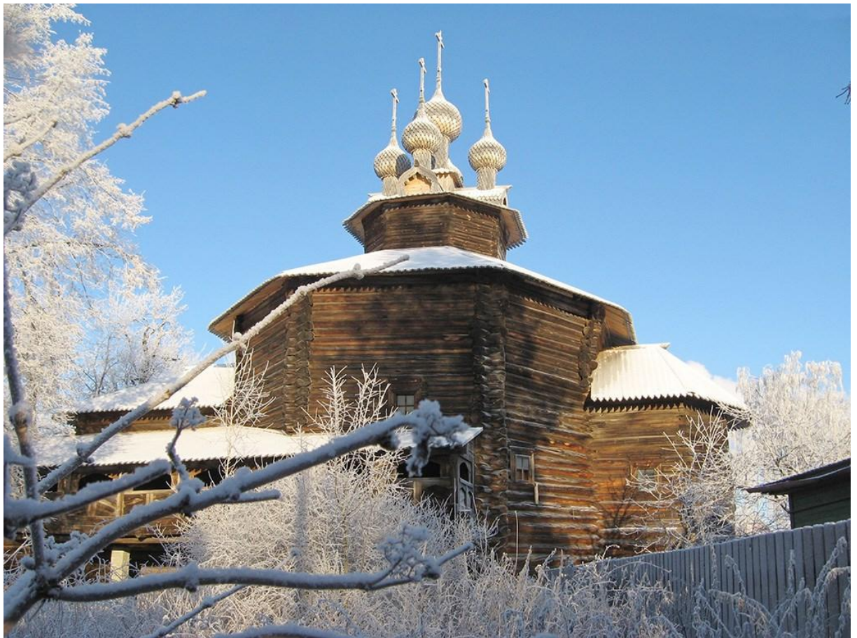
Церковь Всемиловитого Спаса. Церковь в честь Собора Пресвятой Богородицы