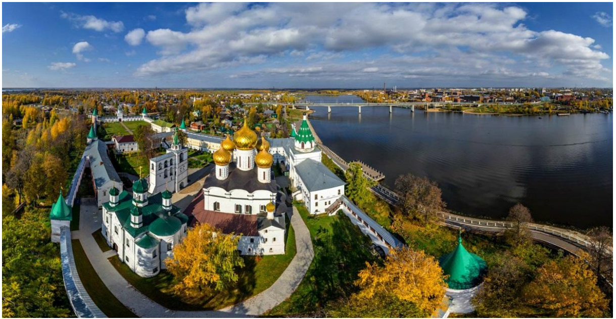
Панорама Ипатьевского монастыря

К середине XVII века Кострома по своему экономическому развитию становится третьим после Москвы и Ярославля городом Московской Руси. Костромские купцы торговали с Востоком и Западом. Тогда же в Костроме возникает большой торговый центр — мясные, мучные, соляные, калашные, шубные торговые ряды.