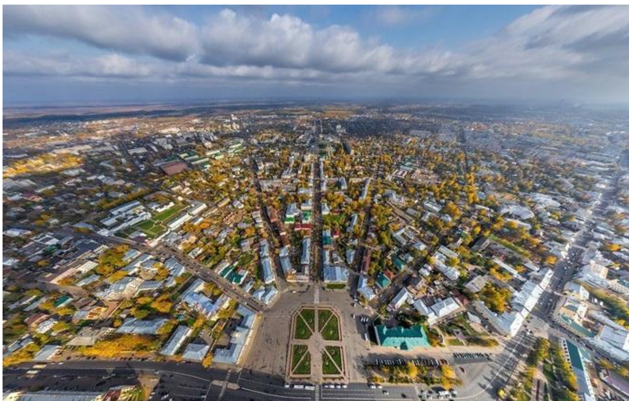
Вид сверху на Сусанинскую площадь

Расцвет города приходится на конец XVIII – начало XIX века. В 1767 году императрица Екатерина II посетила Кострому, даровав ей герб с изображением галеры «Тверь», а также поучаствовав в принятии генерального плана застройки города. И в настоящее время в исторической части Костромы сохраняется уникальная веерная застройка, когда от Сусанинской площади, которую костромичи часто называют «сковородкой», лучами расходятся 8-ь главных улицы.