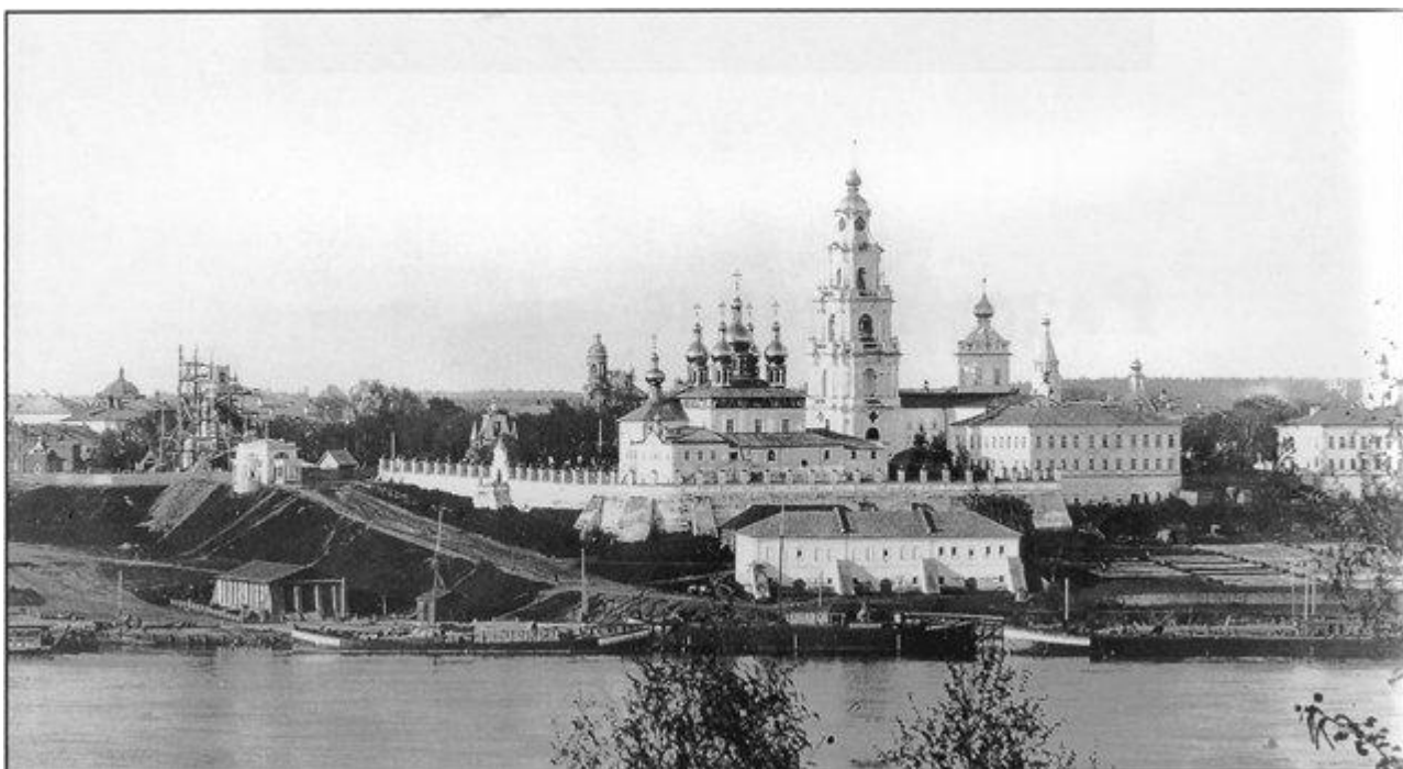
Начало XX века. Вид на левый берег Волги с Костромским кремлём (не сохранился до наших дней)

14 января 1929 г. постановлением ВЦИК СССР Костромская губерния была упразднена. Она входила изначально в состав Ивановской, а затем Ярославской областей. Но это не означало конец истории города. Индустриализация здесь шла высочайшими темпами, например, в 1932 году был открыт железнодорожный мост, существенно упростивший транзит грузов по стране.