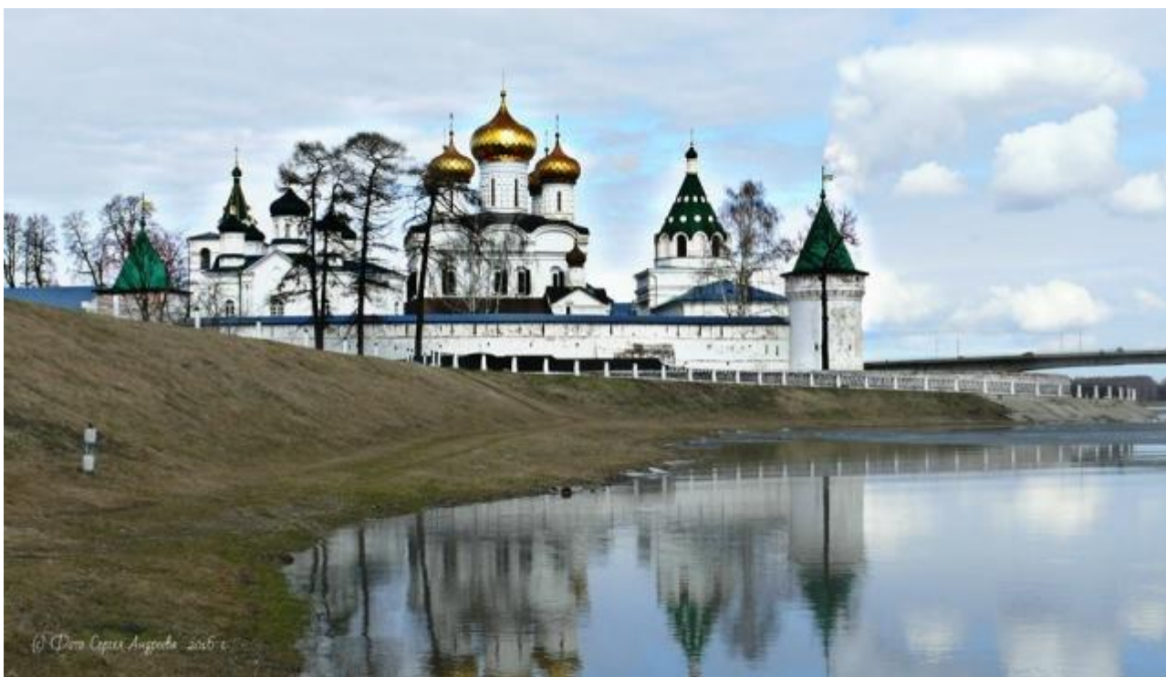
Ипатьевский монастырь на стрелке Волги и реки Костромы

Первое летописное упоминание о существовании Костромы, как значительного города, относится к 1213 году, когда здесь случился большой пожар. В первой половине XIV в. (1364 г.) Кострома входит в состав Московского княжества, с тех пор её история неотделима от развития и культуры общерусского государства.