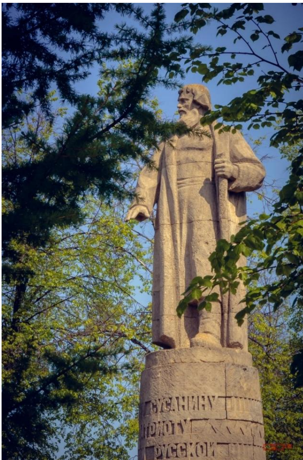
Памятник народному герою – Ивану Сусанину

14 марта 1613 г. из Ипатьевского монастыря Михаил Федорович Романов был призван на царство. Кострома стала родиной династии Романовых, правившей в России более 300 лет.