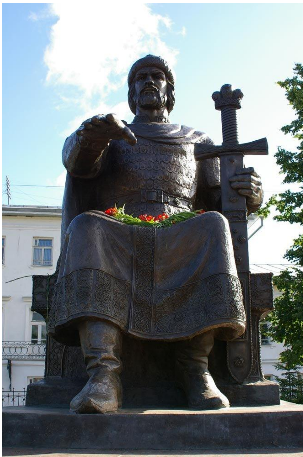
Памятник князю Юрию Долгорукому – основателю города

Название «Кострома» историками объясняется по-разному. Возможно, город назван по имени реки Костромы, на берегу которой стоит. По другой версии, название может быть связано с персонажем крестьянских поверий – Костромой – соломенным чучелом, которое сжигали с приходом весны. Самая же популярная версия отсылает нас к временам, когда на берегах Волги к зиме складывали большие «костры» леса, которые позже сплавляли по реке.