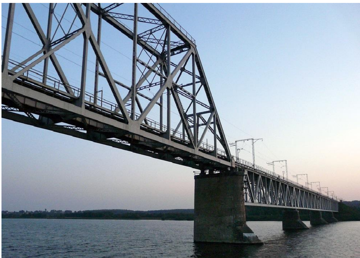
Железнодорожный мост через Волгу

14 января 1929 г. постановлением ВЦИК СССР Костромская губерния была упразднена. Она входила изначально в состав Ивановской, а затем Ярославской областей. Но это не означало конец истории города. Индустриализация здесь шла высочайшими темпами, например, в 1932 году был открыт железнодорожный мост, существенно упростивший транзит грузов по стране.