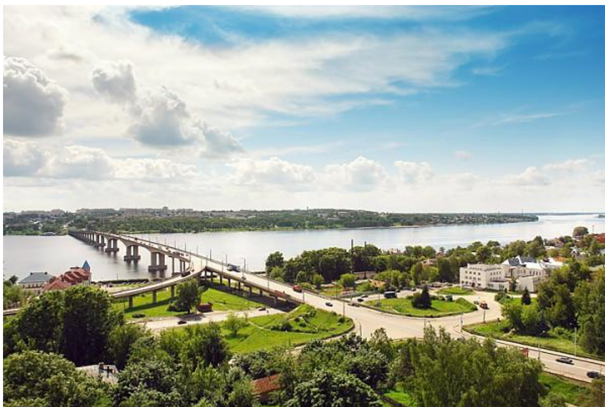
Авто-пешеходный мост через Волгу

В 1970 состоялось открытие авто-пешеходного моста через Волгу, соединившего два берега (и в настоящее время город разрастается на двух берегах).