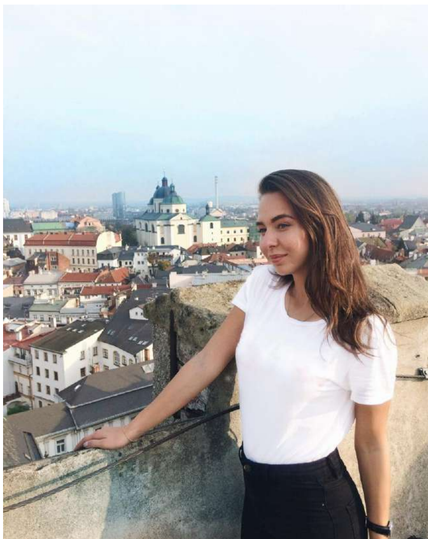
Костёл Святого Маврикия (Kostel svatého Mořice)