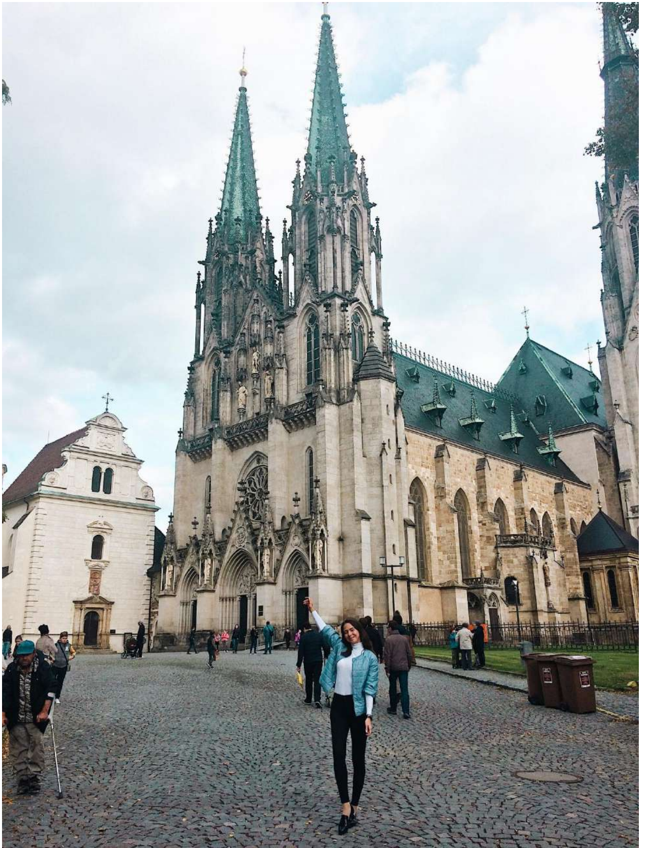
Собор Святого Вацлава