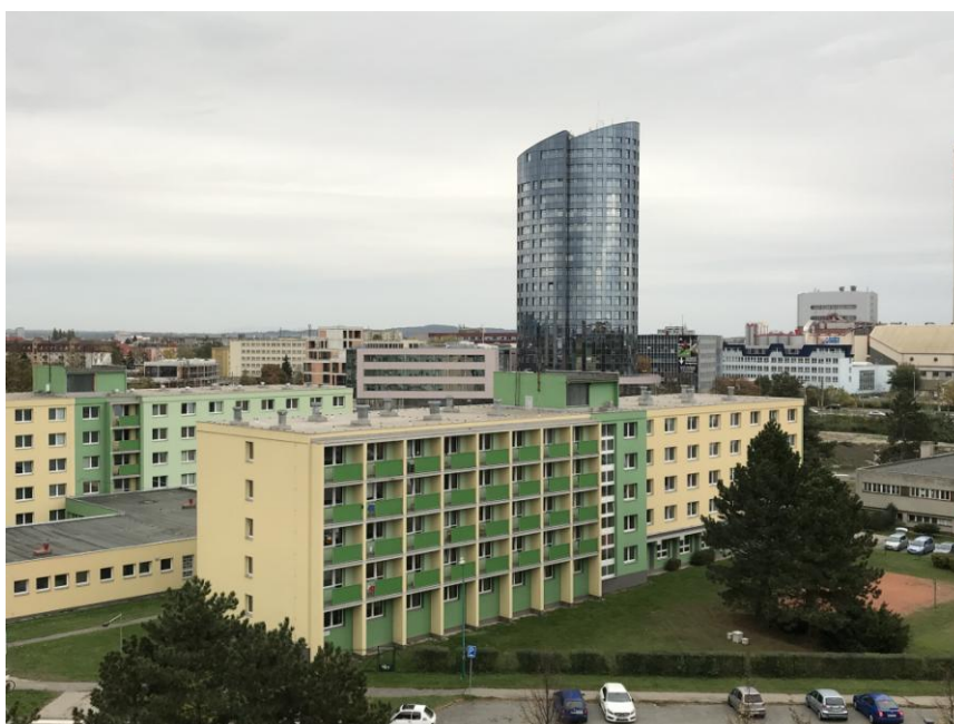
Студенческое общежитие Университета им. Палацкого