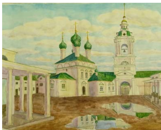
Колокольня Спаса в рядах. Автор акварели Я. Кузнецов. 2021

На Костромской земле известны следующие документированные работы зодчего: Церковь Воскресения Христова в Нерехте, восстановление Успенского собора в Костроме, церковь и колокольня в селе Левашово, колокольня при Предтеченской церкви в Костроме, колокольня при Благовещенской церкви в Нерехте, церковь Преображения в Нерехте. Петропавловская церковь в Костроме, Крестовоздвиженская кладбищенская церковь в Нерехте, Мучные и Красные ряды в Костроме. Есть работы, авторство которых не установлено документами: Никольская церковь на погосте Николо-Бережки близ Щелькова,