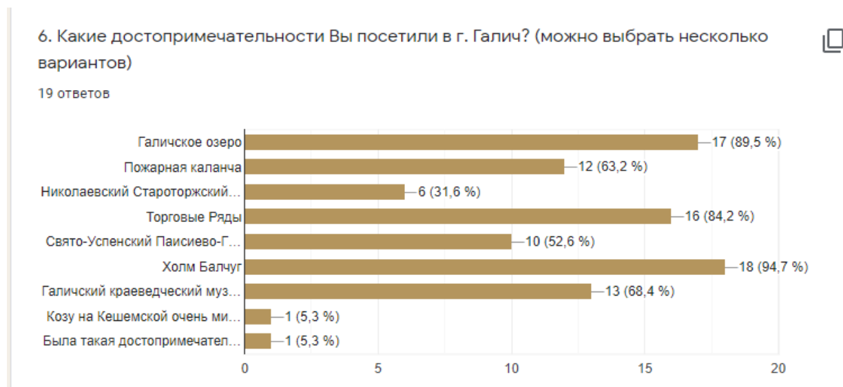
Рис. 1. Востребованность достопримечательностей г. Галича

Мнения респондентов распределились следующим образом (рис. 1): наиболее посещаемыми местами в городе Галиче являются холм «Балчуг», Галичское озеро и Торговые Ряды. Можно сделать вывод о том, что данные достопримечательности города являются самыми востребованными. Менее посещаемыми оказались Староторжский Николаевский монастырь, Свято-Успенский Паисиево-Галичский монастырь. Были предложены и такие варианты: «Коза на Кешемской» и «Паром через Озеро». «Коза на Кешемской» была построена в 2021 г. и окончательно введена в эксплуатацию совсем недавно. «Паром через Озеро» в настоящее время, к сожалению, отсутствует.