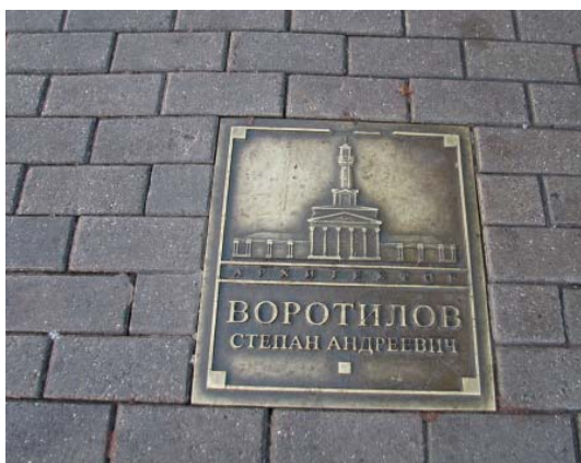
Памятная табличка в Костроме на Аллее Признания. 2012

Сегодня имя Степана Воротилова не носят улицы городов, оно не сверкает золотыми буквами на бортах белоснежных теплоходов, плывущих по Волге. Нет величественных, да что там величественных, нет обыкновенных памятников, напоминающих о нашем выдающемся земляке. Есть лишь скромная бронзовая плита на Аллее Признания в городе Костроме.